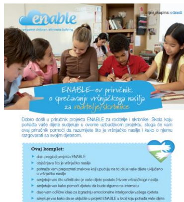
Slika 3. Komplet sadržaja za roditelje/staratelje

Komplet sadržaja za roditelje/staratelje s informacijama o tome kako osigurati sigurnost djeteta, online i offline, uključuje i aktivnosti koje zajednički mogu provoditi i kod kuće.