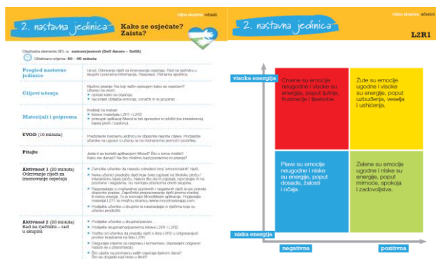
Slika 1. Primjer nastavne jedinice i pripreme za nastavu