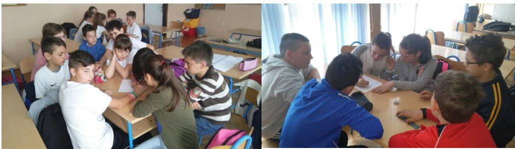
Slika 5. Radionice učitelja i učenika

U školama su održane radionice za učitelje i učenike kako bi se upoznali s projektom ENABLE i njegovom provedbom. Predstavljeni su im svi materijali koji će učitelji koristiti na svojim radionicama s učenicima, a koji će im pomoći da najbolje ostvare ciljeve planiranih aktivnosti.