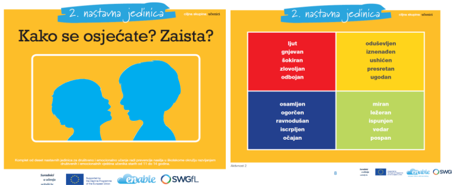
Slika 2. Primjer prezentacije za nastavni sat

Nastavne teme, osmišljene su kako bi bile zanimljive, poticale na istraživanje i vodile učenike raznim putevima do rješenja: